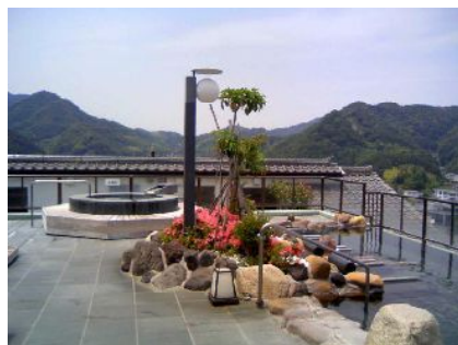
八景園屋上・天空風呂

5月27日(水)GS部遠足は伊豆長岡温泉と駿河湾クルーズ。総勢87名がバス2台に分乗して内浦湾の三津浜へ。軽い船旅気分を味わった後、昼食と温泉。屋上露天風呂で極楽気分。帰りは『時之栖』に立ち寄り御殿場高原ビールやソーセージを味わうなど、盛り沢山の楽しい一日を過ごした。