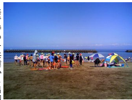
水は冷たいが お天気はサイコー

今にも泣き出しそうな空…。一路土肥に向かって進んでいくと案の定途中から窓を打つ雨、しかし宿についてお昼を食べる頃には薄日が差し込みいざ海岸へ、勇んで海に入るが冷たいなんてもんじゃなく本当に20分も遠泳が出るのかコーチ達に不安の顔が、それでも子供達はものともせず歓声を上げて遊ぶ。 一夜明けると雲一つない夏の日差しの中、遠泳参加者17名の子供達は浮島4つをぐるりと回り25分程かけて完泳した。