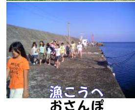
漁こうへ おさんぽ