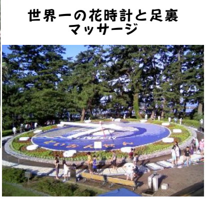
世界一の花時計と足裏 マッサージ