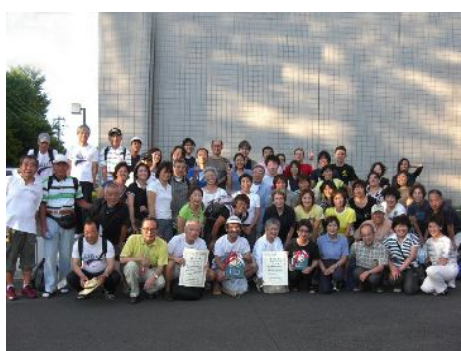
戦いすんで日が暮れて……。

第43回東京都町村総合体育大会水泳競技が7月26日(日)東久留米市スポーツセンター(屋内短水路)で開催された。都下22市町村から多くの選手が参加して熱戦を繰り広げた。三鷹市も選手、役員、監督、マネージャー、70余名が路線バス2台をチャーターして参加。今年から得点のルールが変わったが、男子は予想外の大健闘。8連覇の女子は想定外の苦戦。結局、男子が総合優勝。女子は惜しくも青梅に1点差の準優勝となり、金13、銀16、銅19、4位〜6位迄の入賞が29、大会新記録樹立数は5であった。