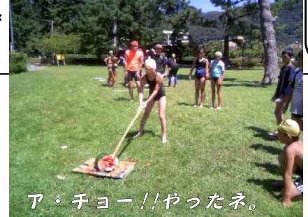
ア・チョー!! やったネ。