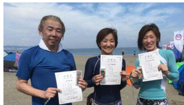
スイカと受賞に笑顔の面々 OWS=オープンウォータースイム

波や周囲を人に囲まれるなど、普段泳いでいるプールとは全く勝手が違いましたが、それも新鮮な経験で、レース後のスイカ食べ放題も大いに楽しみました。例年行われているとのことなので、ぜひ来年も参加できればと思います!