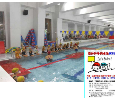
夏休み子ども水泳講習会 Let's Swim! 日程：7月23日(日)～27日(木) 5日間 会場：武蔵野の森総合スポーツプラザ 参加費：10,000円(税込) 申し込み：8月1日(水)まで お問い合わせ：03-3463-1111

7月23日大勢の子供達がプールに集まって来ました。夏休み子ども水泳講習会の初日です。①水慣れ②クロール③平泳ぎの3つのクラスに分かれて練習をします。まず泳力検定を行い、3つのクラスの中で泳力別に分かれてそれぞれ目標を持って練習します。最初は不安で緊張した面持ちの子供も目を追うごとにコーチや友達に慣れて笑顔を見せてくれるようになります。ブルブイやビート板など色々な道具を使って練習を重ねます。5日間連続して行われる事で昨日出来なかった事が今日出来るようになったり、泳げなかった子が泳げるようになったり、泳ぐ距離が伸びたり子供の力は凄いなと驚かされます。